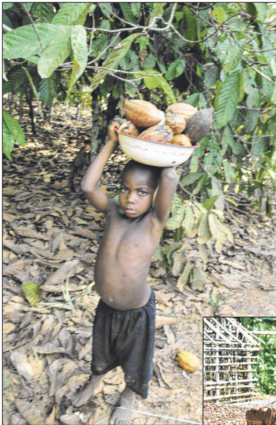
Trop souvent, en Côte d'Ivoire ou au Ghana, les enfants sont encore exploités dans les petites plantations familiales.

Divers fabricants de chocolat ont mis en place des projets visant à la fois des améliorations sociales et de productivité. Ainsi en est-il de l'initiative Cocoa Horizons du groupe Barry Callebaut, le